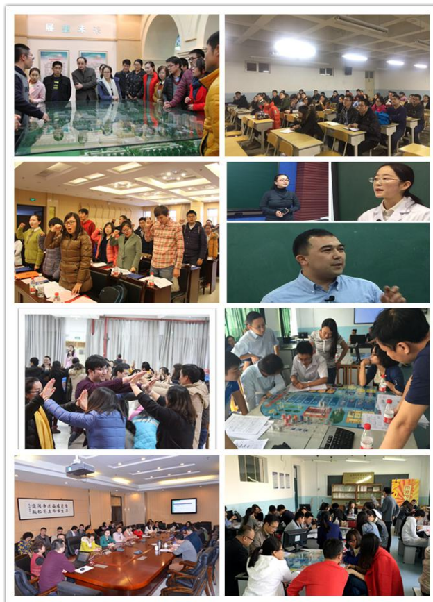
新进教师训练营活动

职教师培训工作。为完善新入职教师培训机制，起草了《新疆农业大学新入职教师培训管理办法》，以教学能力培养为重心，改进培训方式和重点。