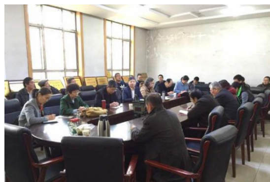
自评验收意见反馈会