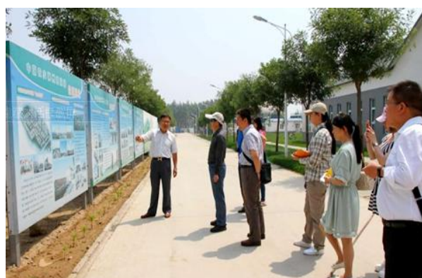
在中国农业大学调研

为帮助广大教职员工更多地了解现阶段高等教育动态，学校评建办公室定期收集相关信息，分别以“应用型转型”、“创新创业”、“质量报告”、“高教改革”、“审核评估”和“互联网+”等为主