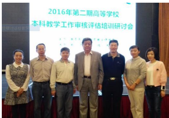
参加教育部审核评估研讨会